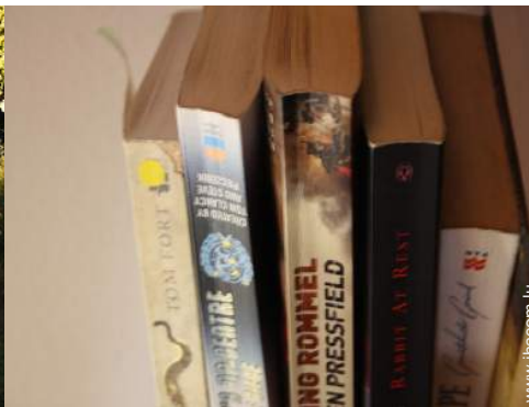
collection de livres