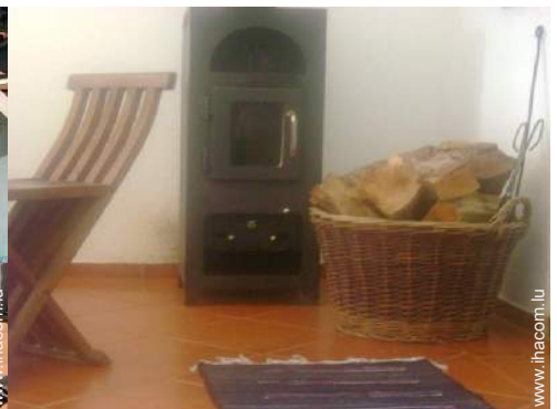
poêle à bois