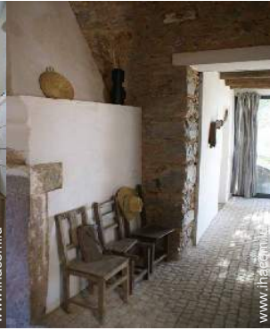
Ancienne Ferme de Charme