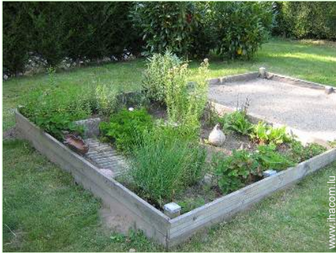
bac à sable