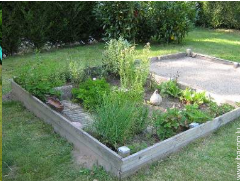
bac à sable