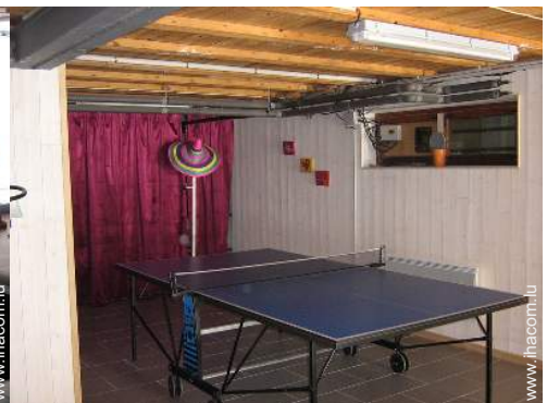
salle de jeux