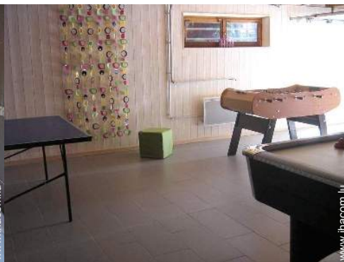
salle de jeux