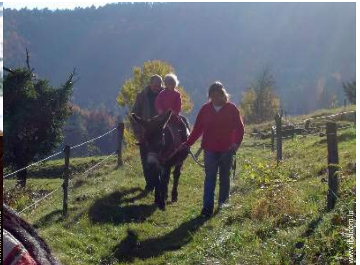
balade à dos d'âne