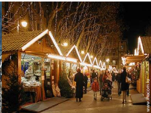
vue sur village