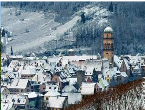
vue sur village