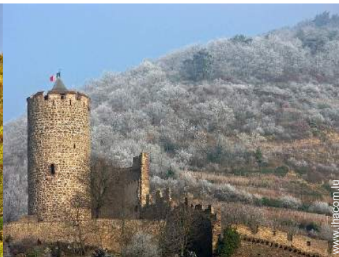
chemin de promenade