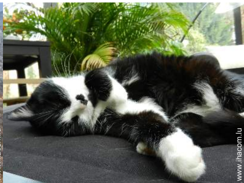
Les animaux de la maison