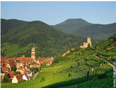
vue sur vignobles