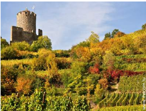
vue sur vignobles