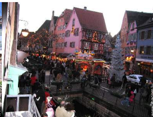
vue sur la place