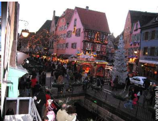
vue sur la place