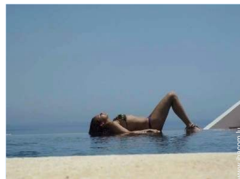
Piscine à débordement