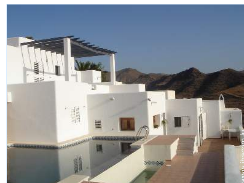
Piscine à débordement