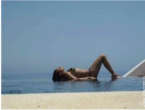
Piscine à débordement