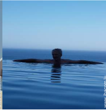
Piscine à débordement