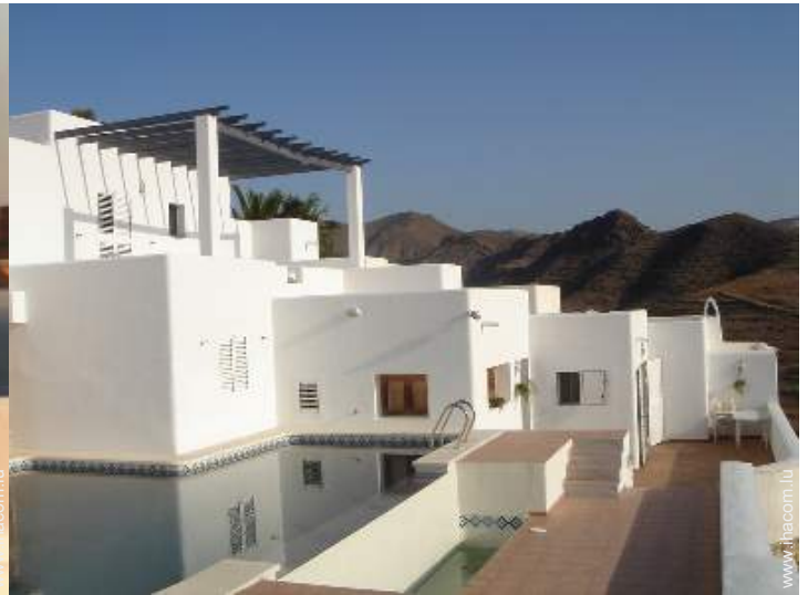
Piscine à débordement