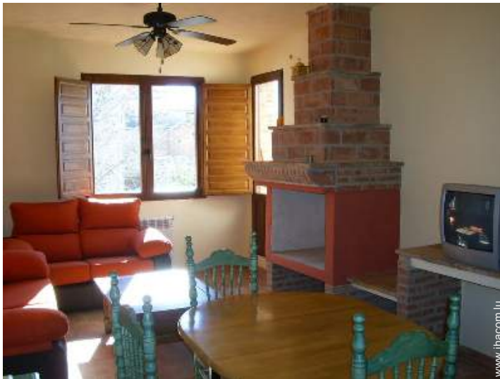
Maison de Charme