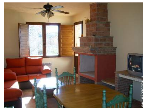
Maison de Charme