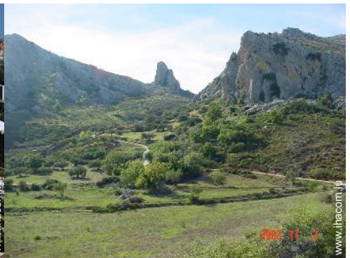
vue sur montagne