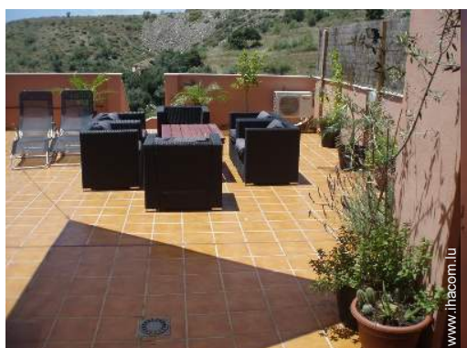
terrace sur toit