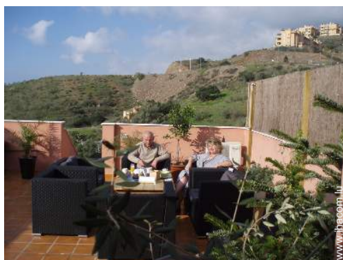
terrace sur toit