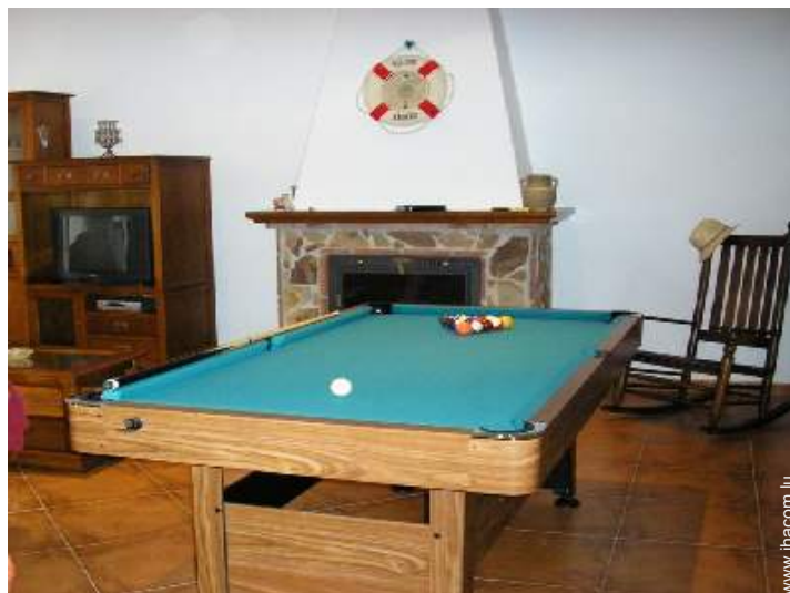
table de billard