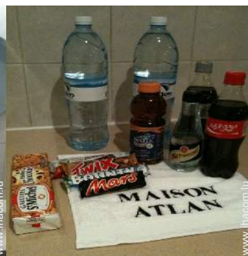
Confort intérieur à disposition des hôtes