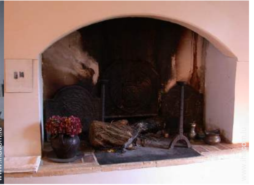
salon de musique