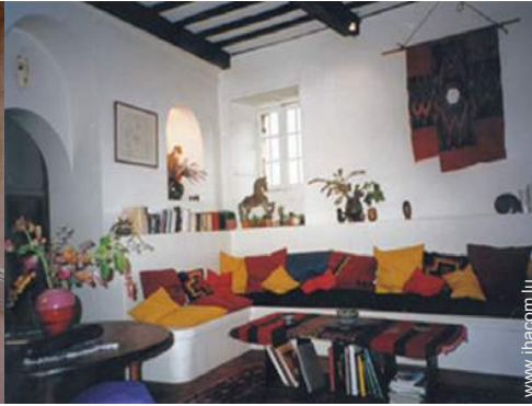
salon de musique