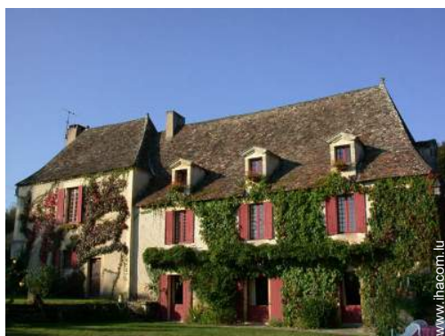
Bastide de Charme