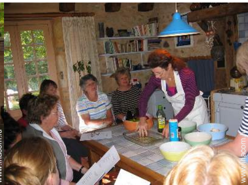
grande cuisine indépendante