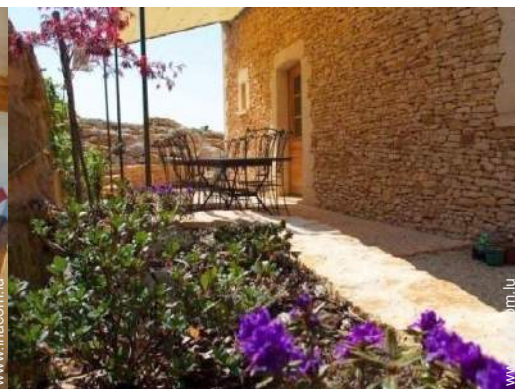
table(s) de jardin