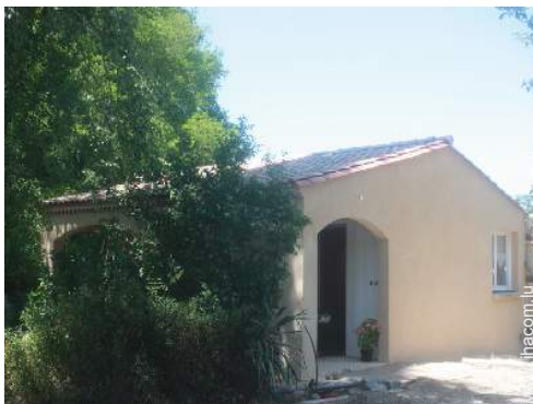
Maison de Charme