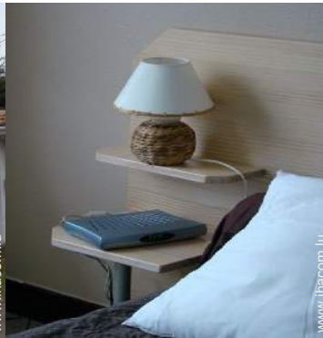
wifi (accès internet sans fil)