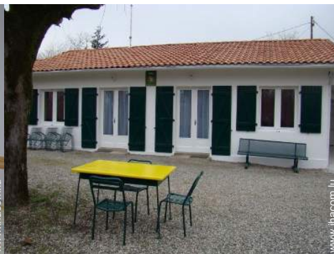
salon de jardin