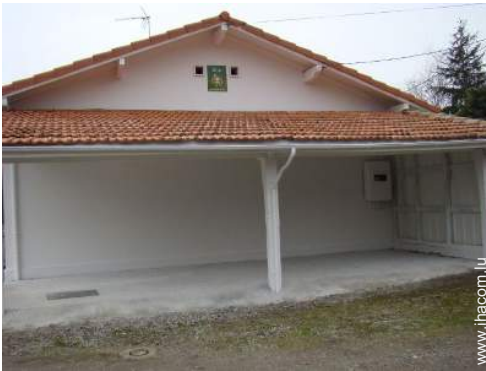
Installation extérieure à disposition des hôtes