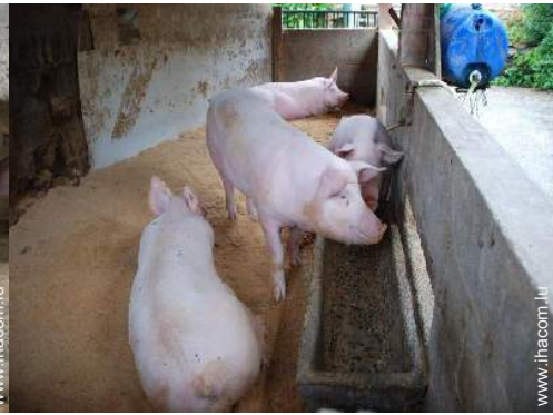
animaux de ferme