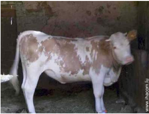
animaux de ferme