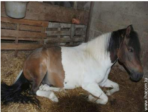
animaux de ferme