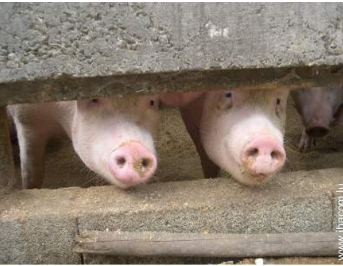
animaux de ferme