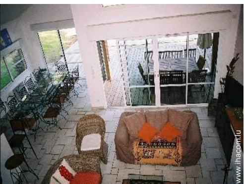
vue depuis la mezzanine