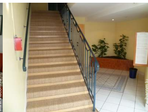
Résidence de standing