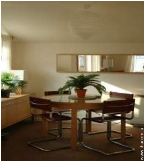
Cottage de Charme