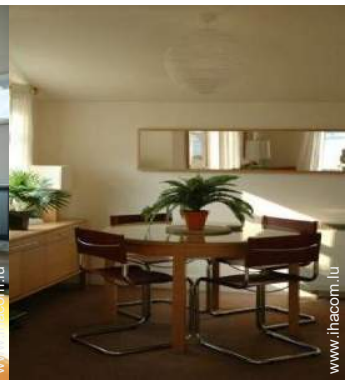
Cottage de Charme