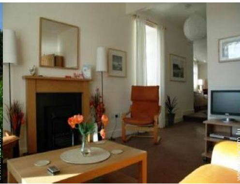
Cottage de Charme