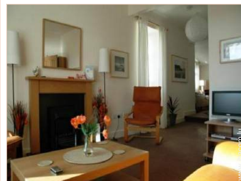
Cottage de Charme