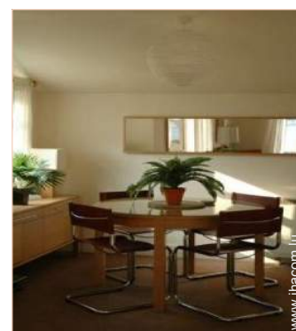
Cottage de Charme