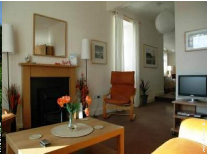
Cottage de Charme