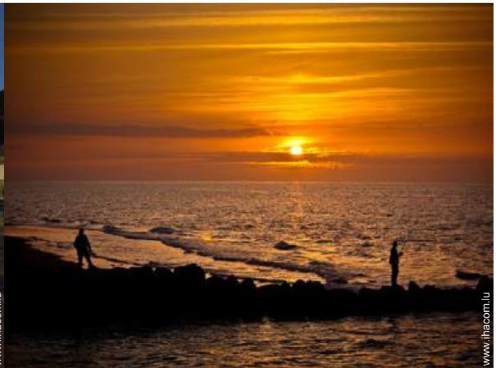
vue sur océan