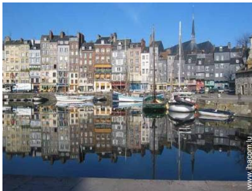
port de plaisance