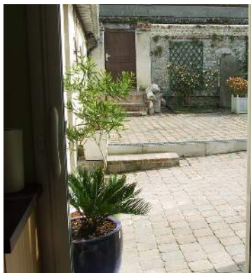
vue sur cour