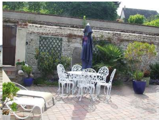
Equipements à disposition