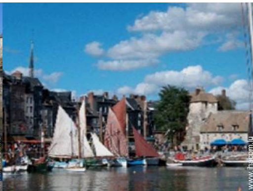
port de plaisance