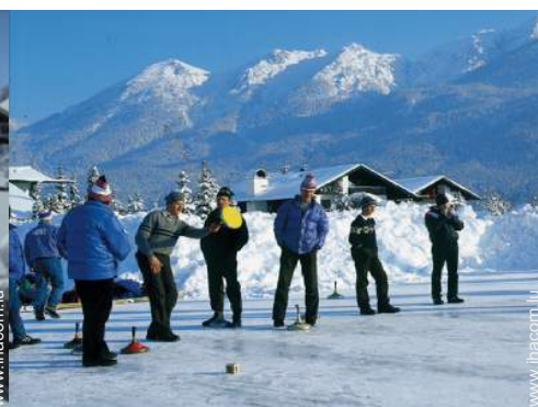
loisirs d'hiver à proximité