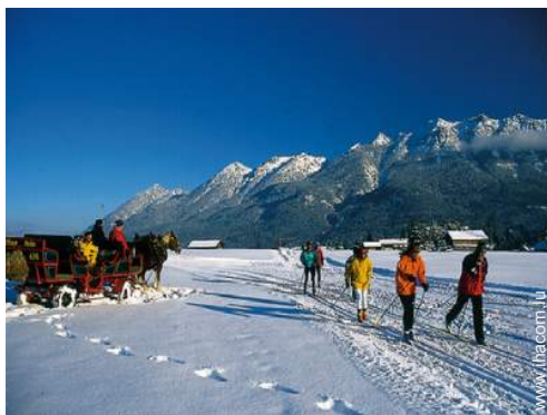
loisirs d'hiver à proximité