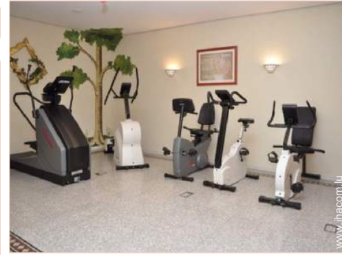
machine(s) de musculation