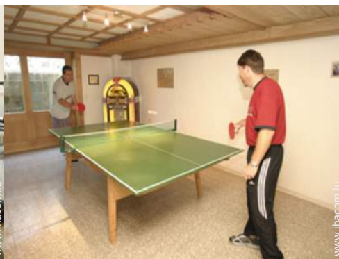
table de ping-pong