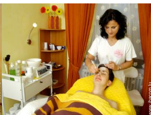
soin de beauté