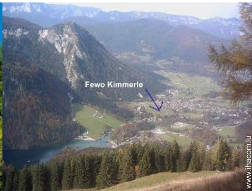
vue sur centre village