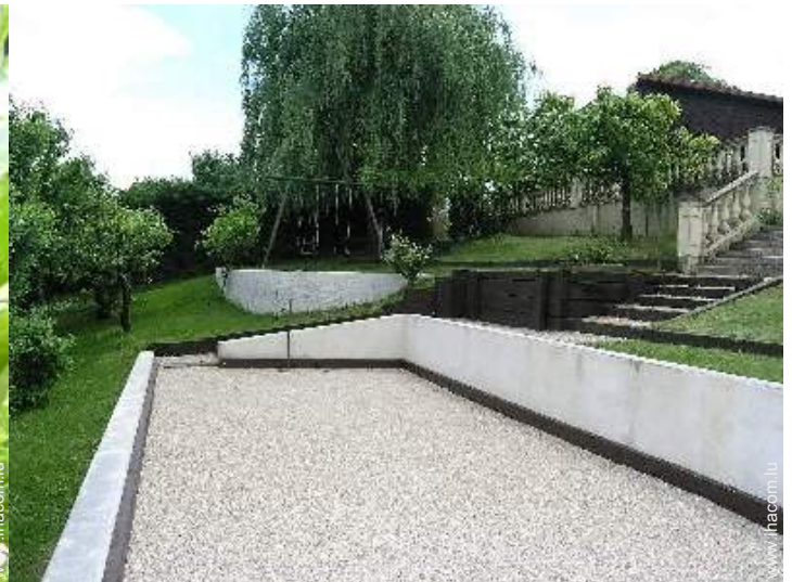
jeux de boules de pétanques