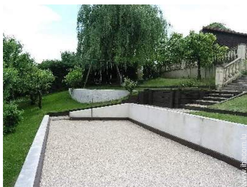
jeux de boules de pétanques