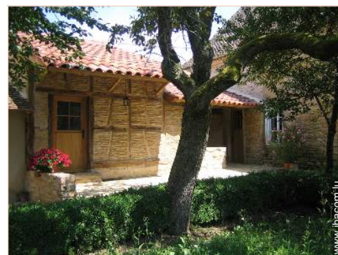
Maison de Charme