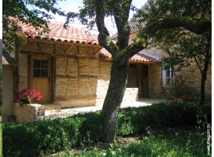
Maison de Charme