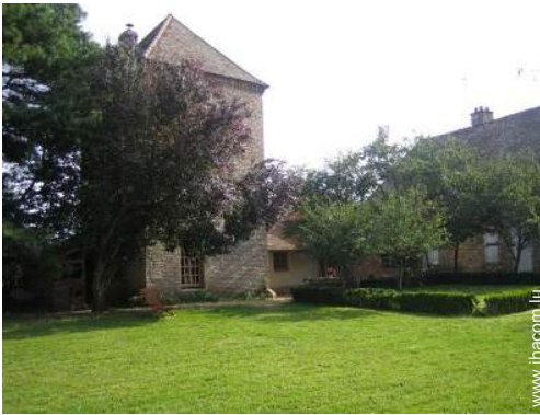
Maison de Charme