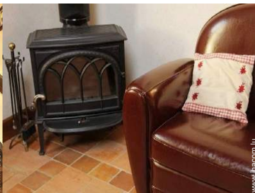
poêle à bois