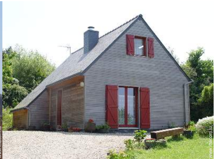
Maison en Bois