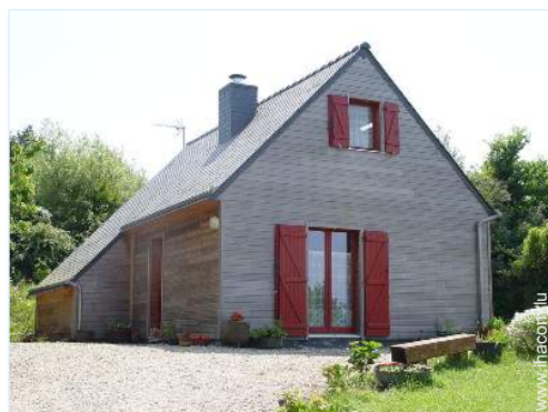
Maison en Bois