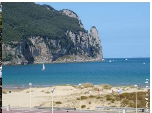
Attraites et détente