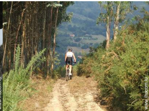
VTT (itinéraire circuit)