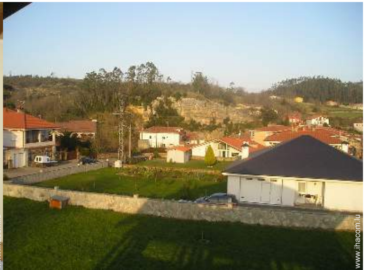
vue sur rue/avenue