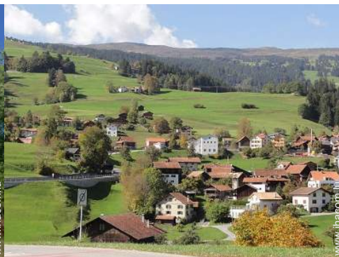
vue sur campagne