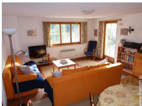
Confort intérieur et équipements