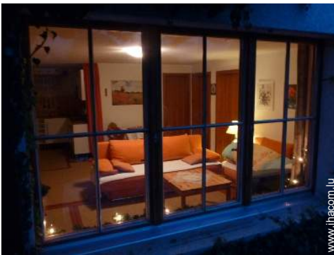
Confort intérieur et équipements