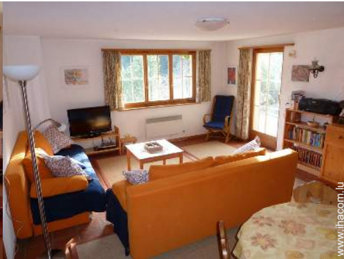
Confort intérieur et équipements