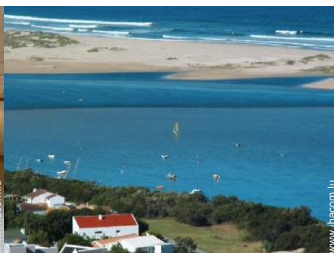
planche à voile