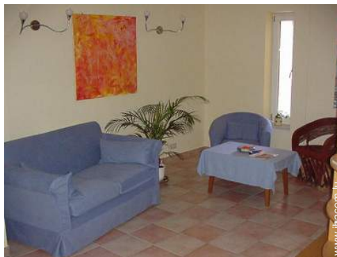
collection de livres