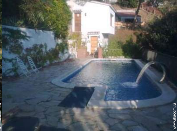
Piscine d'eau de mer