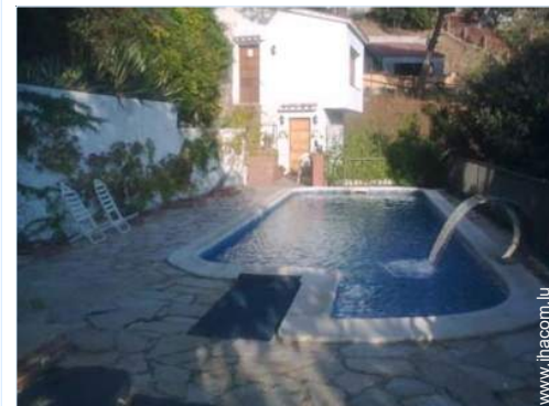
Piscine d'eau de mer