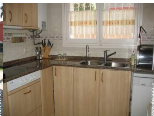
plaques de cuisson