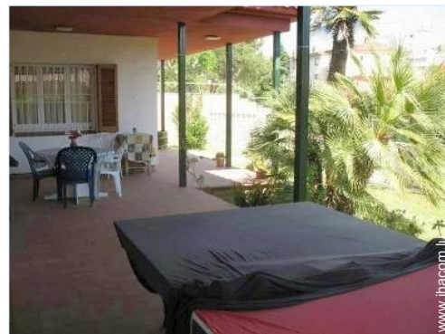
chaise(s) de jardin