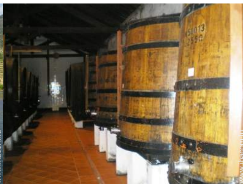
cave et dégustation de vin