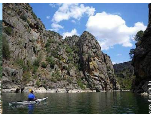
bateau avec rames