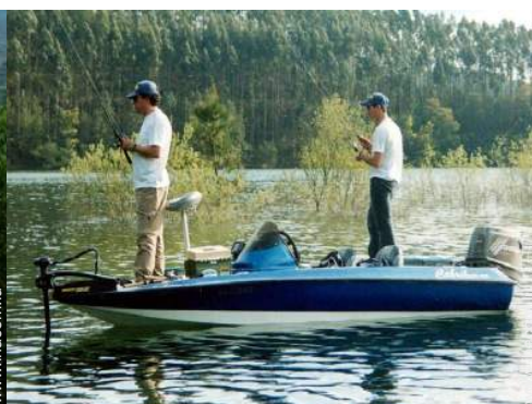
pêche à la ligne