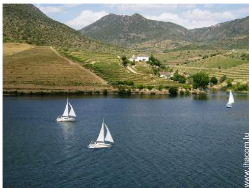
location de bateau