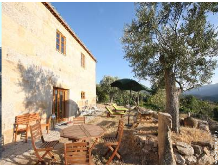
Cadre extérieur à disposition des hôtes