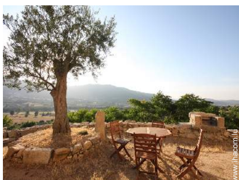
Cadre extérieur à disposition des hôtes