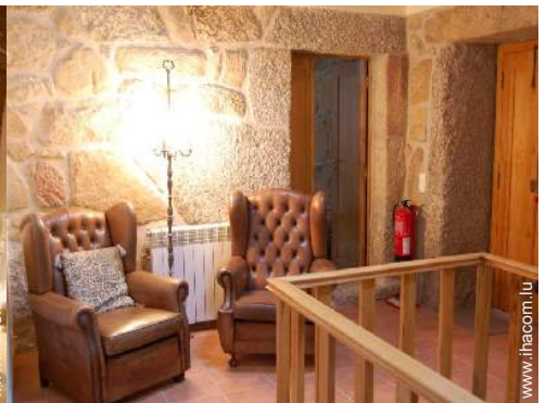
Confort intérieur à disposition des hôtes