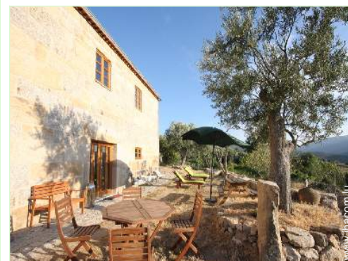
Cadre extérieur à disposition des hôtes