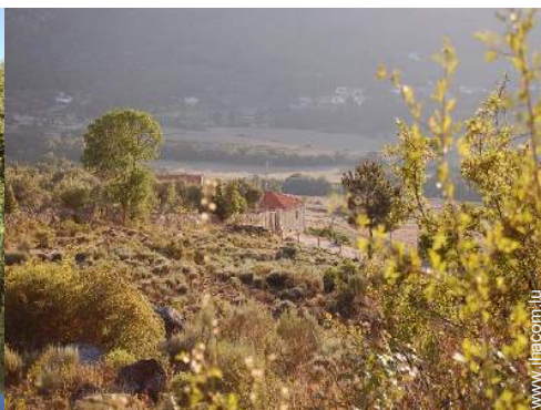
vue sur coucher de soleil