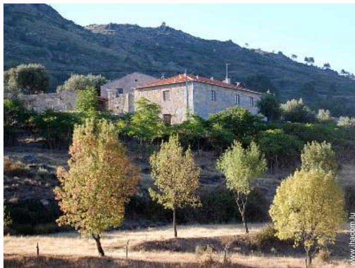
Maison de Campagne