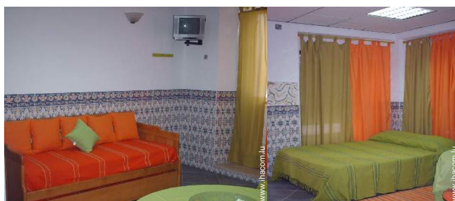
lit tiroir 1 pers