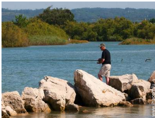
pêche à la ligne