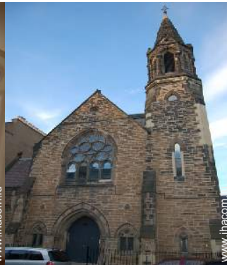
Ancienne Chapelle de Charme