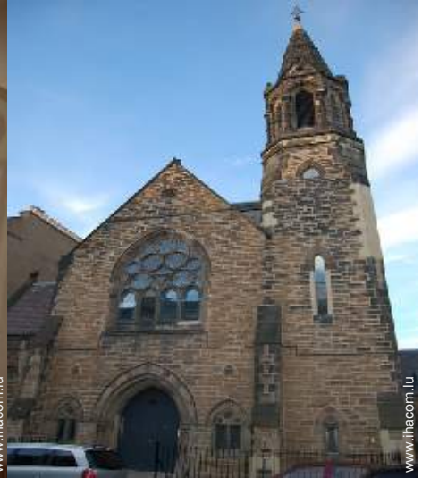
Ancienne Chapelle de Charme