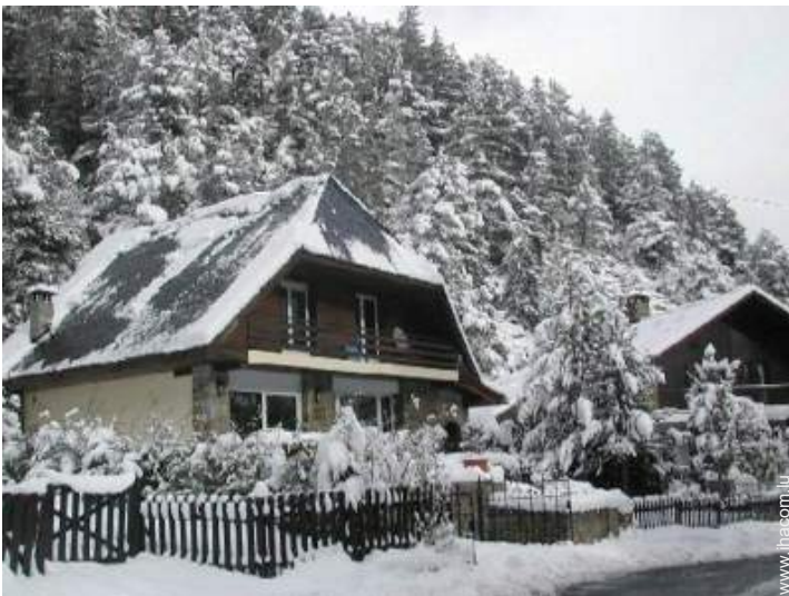
Chalet de Montagne