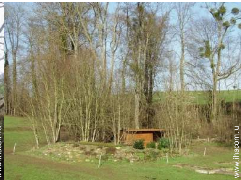
vue depuis le salon