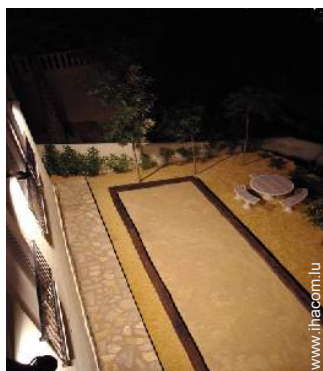
terrain de pétanque