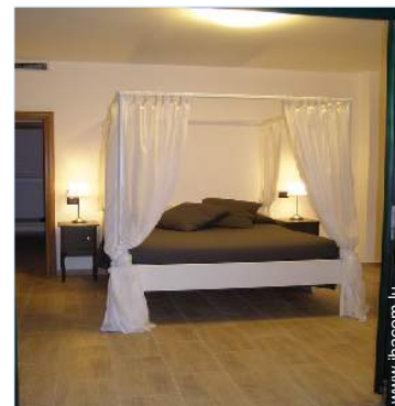
lit(s) double(s) à baldaquin

Salon d'été, barbecue, table(s) de jardin, chaise(s) de jardin, tonnelle, salon de jardin, chaise(s) longue(s), transat(s)