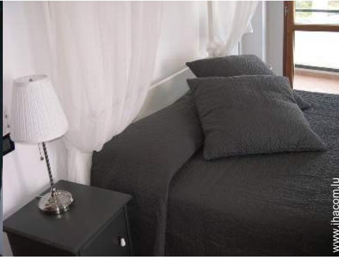
lit(s) double(s) à baldaquin