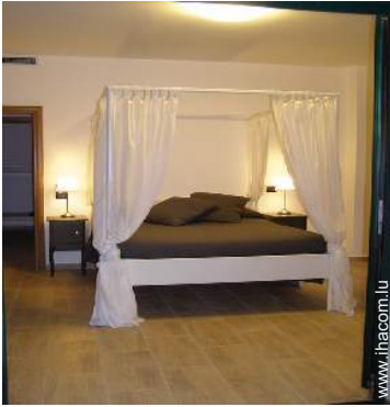
lit(s) double(s) à baldaquin