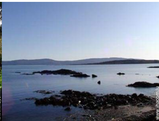
plage de galets