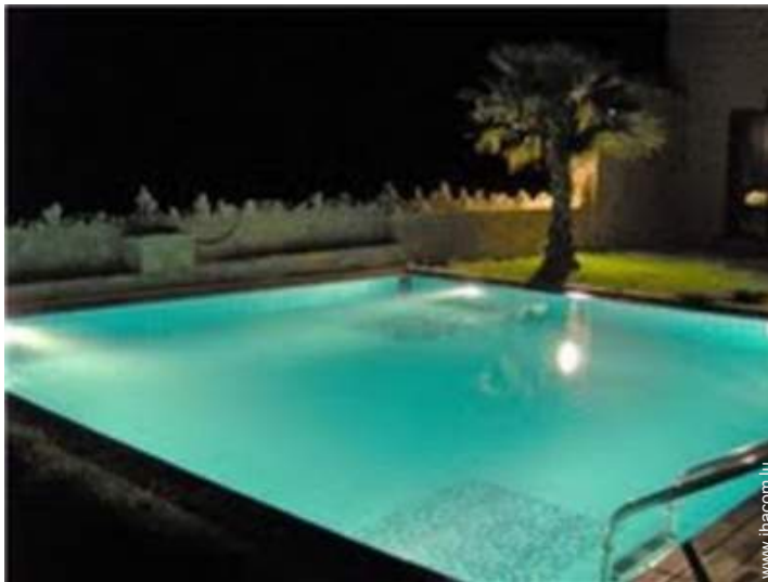
Piscine à débordement