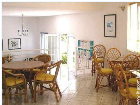
Agencement intérieur à disposition des hôtes