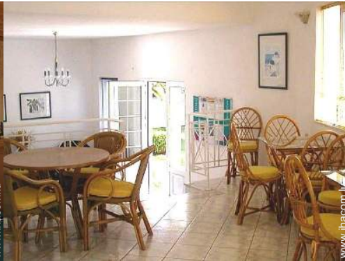
Agencement intérieur à disposition des hôtes