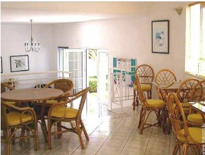
Agencement intérieur à disposition des hôtes