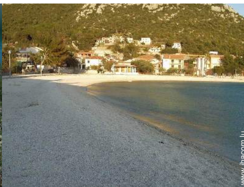
plage de galets