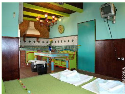
Appartement de Charme