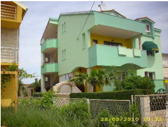
Propriété de Charme