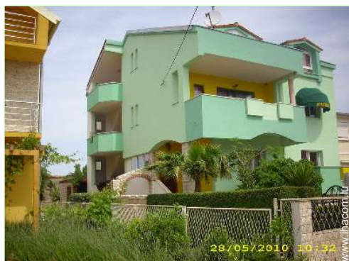
Propriété de Charme