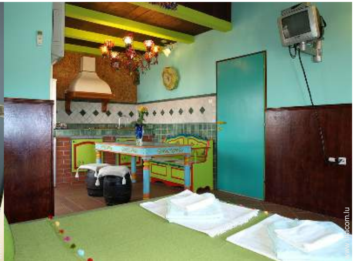
Appartement de Charme